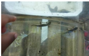
Des bébés batraciens

Cette fois-ci, nous sommes allés découvrir la mare dans laquelle nous avons pêché des trésors d'êtres vivants :