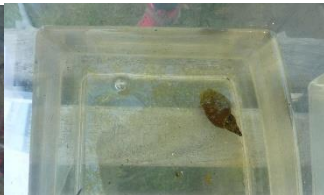
Des bêtes à coquilles