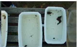
Des punaises aquatiques